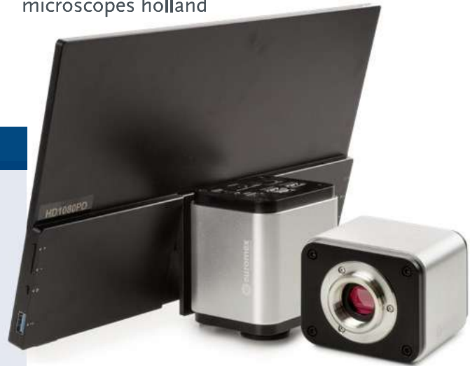
● VC.3048 / VC.3048-HDS