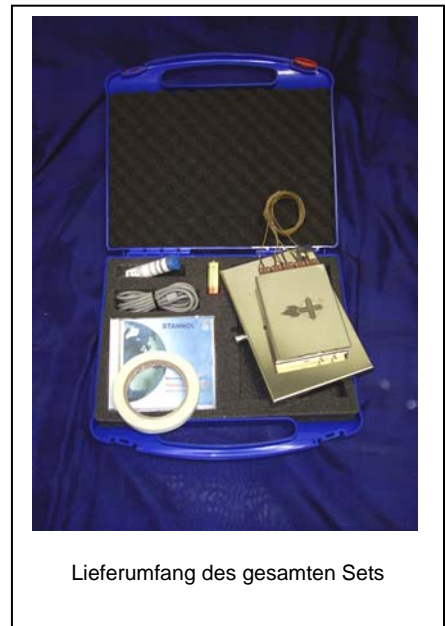
Lieferumfang des gesamten Sets

Zur Überwachung sind selbst bei modernen Lötmaschinen externe Geräte notwendig, mit denen die entsprechenden Lötprofile aufgezeichnet werden können. Da jede Baugruppe ein anderes thermisches Verhalten aufweist, ist es in der Regel notwendig, für jede Baugruppe eine andere Ofenabstimmung zu wählen. Diese müssen durch Temperaturprofilmessungen gefunden und immer wieder überprüft werden, da sich das Verhalten der Lötanlagen durch Verunreinigungen und Alterung verändern kann. Immer häufiger wird von Kundenseite eine Dokumentation über die Einhaltung von Temperaturprofilen verlangt. Daher ist es wichtig, Messsysteme zur Verfügung zu haben, mit denen man schnell und einfach die geforderten Messungen und Dokumentationen durchführen kann.