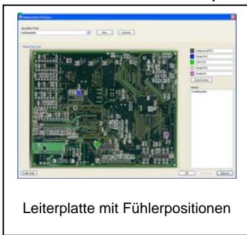
Leiterplatte mit Fühlerpositionen

Im Bereich Stammdaten werden Informationen zu Lötanlagen, verwendete Lote, Hüllkurven und den verwendeten Testleiterplatten hinterlegt.