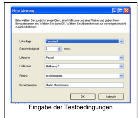
Eingabe der Testbedingungen

Beim Ausdruck erhält man eine Übersicht über Testbedingungen, das Temperaturprofil und die Testleiterplatte mit der entsprechenden Position der Fühler.